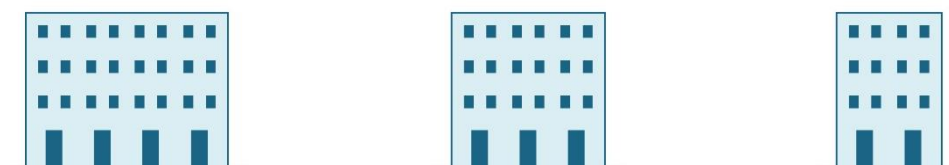
4 atari edo gehiago (+ % 3)