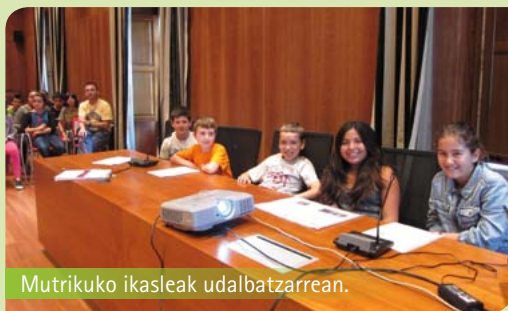
Mutrikuko ikasleak udalbatzarrean.