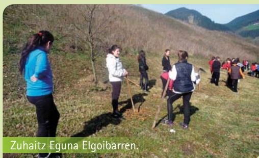
Zuhaitz Eguna Elgoibarren.