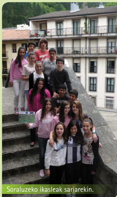
Soraluzeko ikasleak sariarekin.

Durante el próximo curso, y con objeto de darle continuidad al trabajo realizado este año, se seguirá tratando el tema de la movilidad.