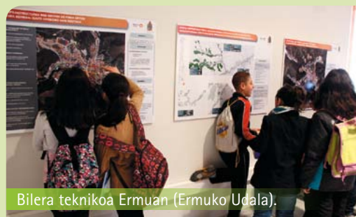
Bilera teknikoa Ermuan (Ermuko Udala).