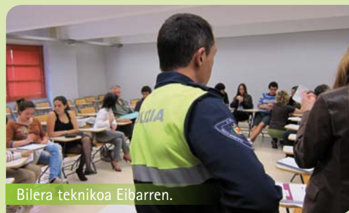
Bilera teknikoa Eibarren.