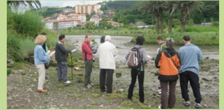
Foroko partaideak Debako hezegunera egindako irteeran.

2010ean foroak lanean jarraituko du eta bertan honakoak landuko dituzte, besteak beste: iaz foroko partaideek aurkeztutako lan proposamen bat aukeratu eta abian jarriko dute; Agenda 21eko ekintza planaren 2009. urteko ebaluazioaren emaitzak aurkeztuko dituzte eta Deban egin berri den bizikleta-bideen aurkezpena egingo da.