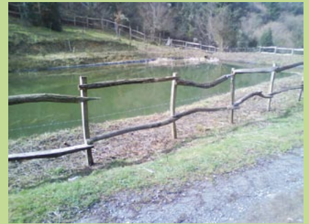
Ormolako putzuan egindako lanak.

Udalak badaki hauek lehen urratsak besterik ez direla eta oraindik lan asko dagoela egiteko.