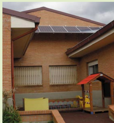
Learreta-Markina eskolako fatxadan jarritako eguzki-panelak.