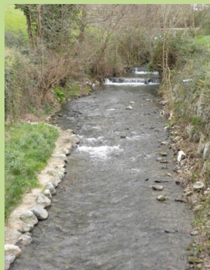
El Kilimon a su paso por Mendaro.

Dagoeneko bi urte igaro dira lanak bukatu zituztenetik eta esan beharra dago Kilimon ibaia poliki-poliki bizia berreskuratzen diharduela.