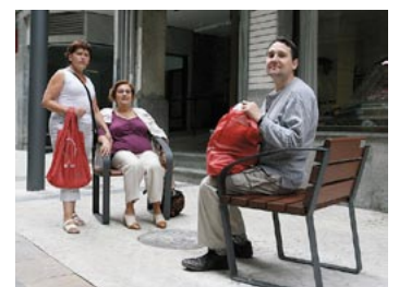
Elgoibarko herritarrek banatutako poltsarekin.