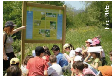
Visita de escolares de Ermua a uno de los paneles colocados junto al río por el Ayuntamiento.

1993. urtetik hona Ermuko lehen hezkuntzako ikastetxe guztiek udalak duen ingurumen-hezkuntzako programan parte hartzen dute. Ermuko Udako Ingurumen Alorrek ikastetxe bakoitzaren hezkuntz testuinguruan barneratzen den ingurumen- eta jasangarritasun-hezkuntzako tailer- eta jarduera-eskaintza zabala du. Landutako gaien artean honakoak: hirigintza, mugikortasun jasangarria, eskolabidea, hondakinak, ura, energia berriztagarriak, biodibertsitatea, Azterkosta eta abar.