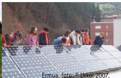
Ermua, foto: © Urkoi 2007.