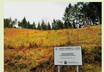
Karakate inguruan Udalak kudeatutako lursaila.

Argi dago oraindik lan asko dago egiteko, eta nahiz eta Baso Bidez aurrea eramateko orduan hainbat zailtasun aurkitu dituzten, garrantzitsuen finantzazioa, Udalak bioaniztasuna eta gure basoak berreskuratzeko apustu garbia egiten jarraituko du. Kontuan izan behar dugu, gure basoak berreskuratzean, bioaniztasunean eta paisaian izango dituen onurez gain, hidrologia eta lurraren kalitatea ere hobetzen direla. Gainera, landa-inguruneke bizimodua desagertzen ari dela kontutan hartzen badugu, geroago eta zailagoa izango da baseritarrek eta lursailen jabeek lurrok modu egokian kudeatzea eta egoera honek etorkizunean arazo larriak sor ditzake. Honela, Baso Bidez ekimenaren bitartez, udalerrinari bizia eman nahi dio Udalak.